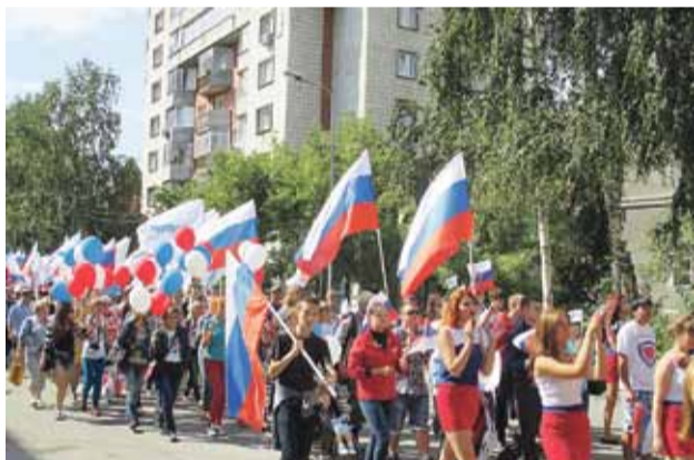
Праздничное шествие в честь Дня флага