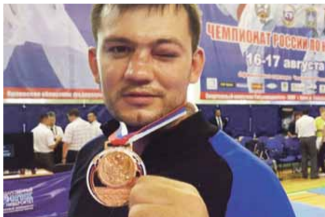
Чемпионат России. Бой был тяжёлым