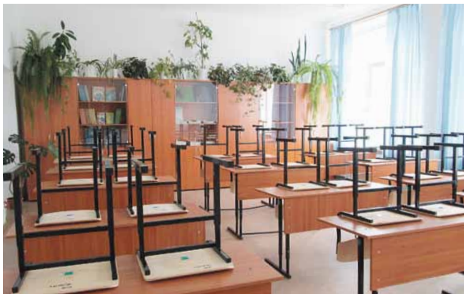
Школа № 30 посёлка Красный Яр ждёт учеников

В этом году в Новосибирском районе за парты сядут 1515 первоклассников