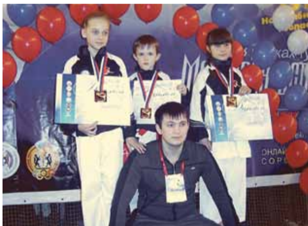
Надежда новосибирского карате