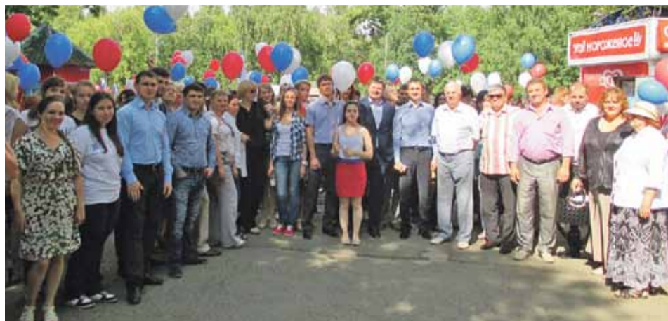
Делегация администрации Новосибирского района