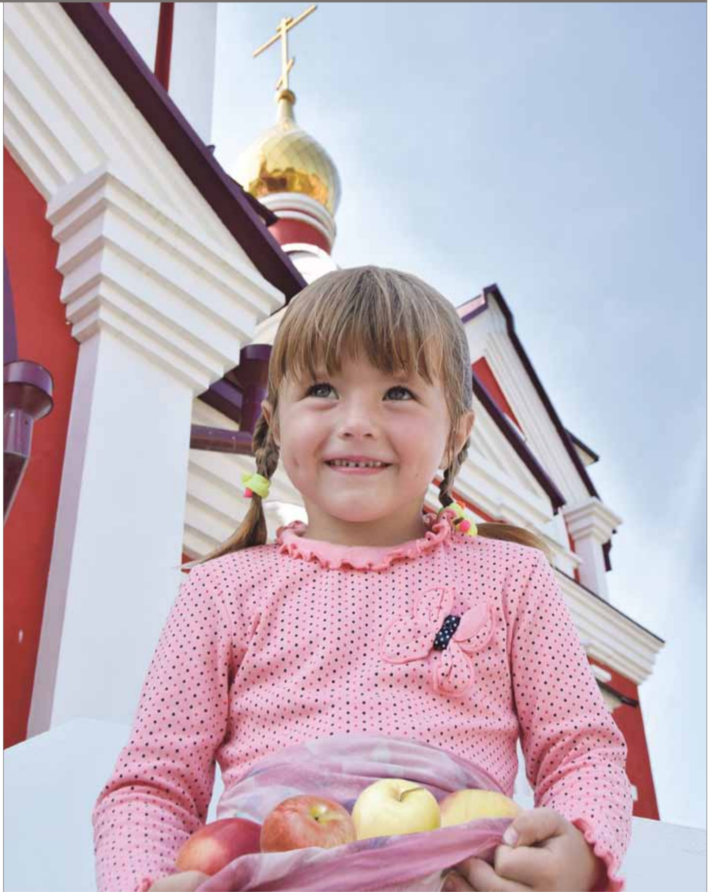
«Что задумано — сбудется». Праздник Преображения Господня. Церковь Рождества Иоанна Крестителя в Криводановке