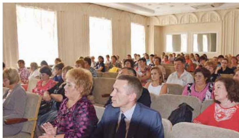
Конференция родительской общественности